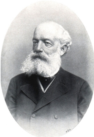
Friedrich August Kekulé

Con estas palabras 1 , el químico alemán Friedrich August Kekulé recordaba el sueño que a mediados del siglo XIX le permitió dar el salto creativo hacia uno de los descubrimientos científicos más fascinantes de su época. Ya se sabía que la molécula de benceno estaba formada por seis átomos de carbono y seis átomos de hidrógeno, pero no se tenía ninguna pista clara sobre su estructura. Poder hallarla se había transformado en una obsesión para varios químicos de la época. Inspirado por este sueño, en 1865 Kekulé publicó un artículo en francés 2 al que siguió otro en alemán 3 al año siguiente. En ellos sugería que los átomos de carbono forman una estructura cerrada sobre sí misma con forma de hexágono, mientras que los átomos